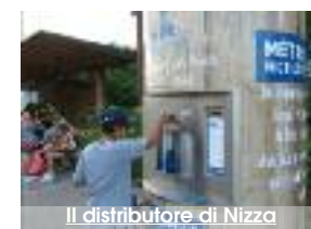
Il distributore di Nizza